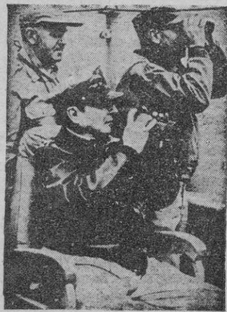
de los guerrilleros, emboscados a los lados del camino en lugares adecuadamente elegidos, consiste en inmovilizar a tiros al primero

Según las últimas noticias recibidas en Tokio, la VII división de infantería norteamericana ha reanudado su avance hacia la frontera con Manchuria, cruzando las frías aguas de los ríos Urgi y Yuki-ko, frente a una resistencia no muy intensa, mientras en el extremo noroccidental frente de cuatrocientos kilómetros, las tropas surcoreanas han sufrido nuevos, aun que no muy importantes reveses. Por su parte, los soldados de la 7.ª división de infantería de Marina de los Estados Unidos, avanzando a través de montañas cubiertas de nieve, han llegado a tres kilómetros de la presa de Chosin.