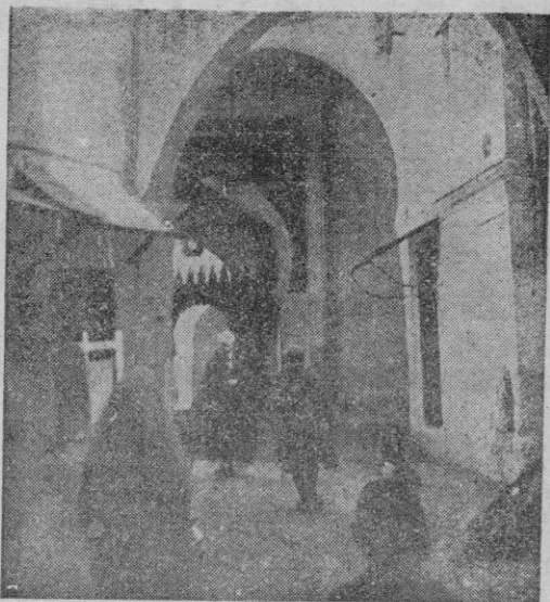
Un rincón africano cuya paz no debe turbarse con el juego.

Pero he aquí que en una revista de la ciudad tangerina se pide que vuelvan a permitirse los "recreos mayores", siquiera reglamentados. Hubo una época en que el juego era uno de los principales atractivos de la ciudad. Funcionaba en más de un lugar, pero tenía su cimera en Villa "Harris", lugar precioso, con pabellones, jardines y una piscina que, según se decía, era la más bella del mundo. El juego era en Tánger la panacea contra todos los males económicos, escribe la aludida revista, y aun añade: "Y de centenares de lejanos lugares venían a