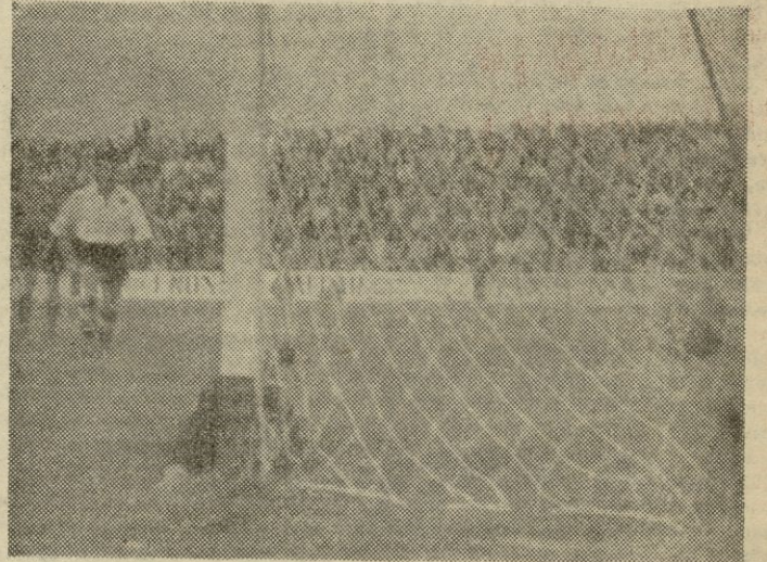
Así fué como consiguió el "Mallorca" el gol que debía darle el triunfo sobre el Salamanca. El meta de éste equipo no pudo evitar el tanto, pese a su esfuerzo.