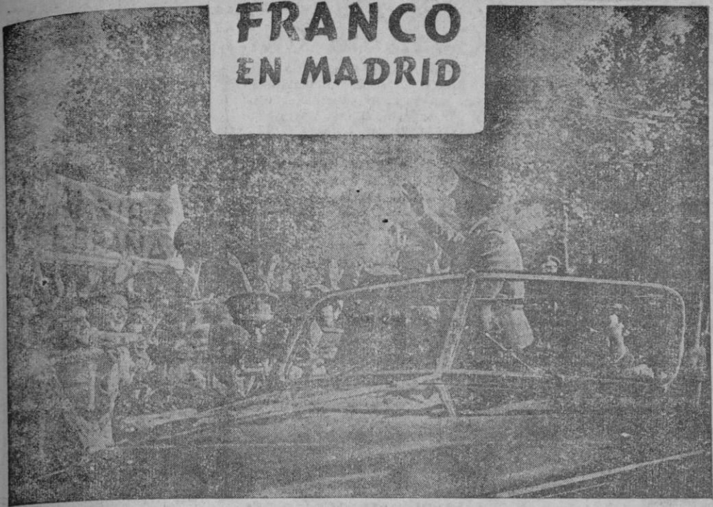
Madrid. — S. E. el Jefe del Estado, Generalísimo Franco, es objeto de entusiásticas aclamaciones por parte de la multitud a su paso por las calles de la Capital, de regreso de su triunfal viaje por tierras de Africa occidental, islas Canarias y Cádiz.