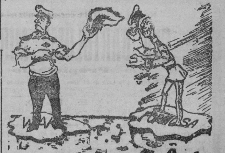
Con la entrevista Mac Arthur-Truman, en Wake, el destino de Formosa quedaba diplomática y militarmente paralizado