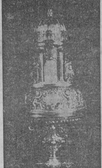
Artístico micrófono que, en nombre de S. E. el Jefe del Estado, el Ministro de Educación Nacional entregó al Sumo Pontífice