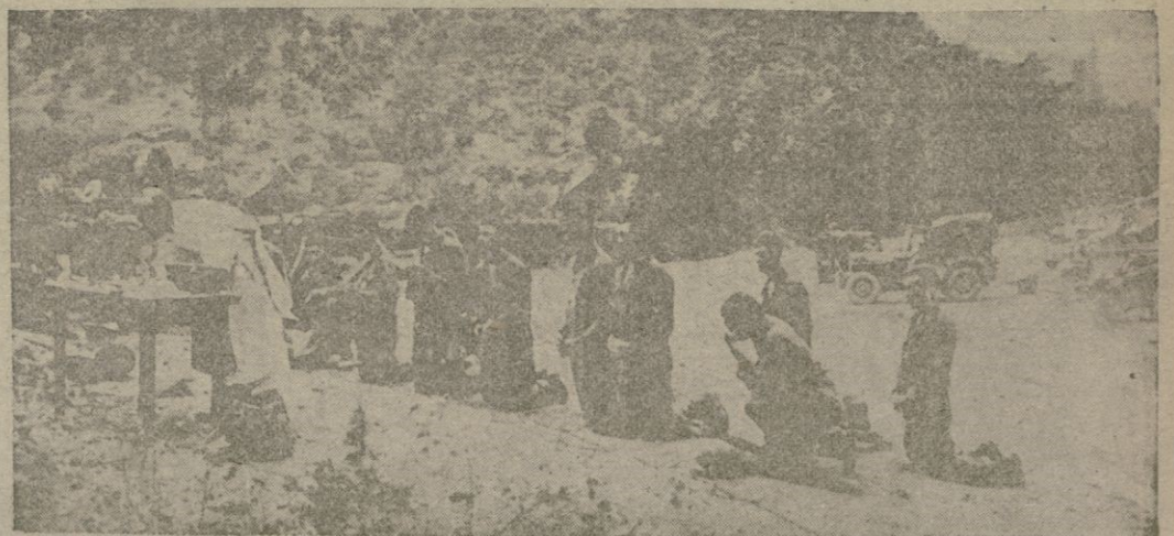
Soldados católicos pertenecientes a las fuerzas de las Naciones Unidas, arrodillado durante la celebración de una misa de campaña en el frente cercano a Young-San, aprovechando uno de los ratos libres que tuvieron.

Esa película se titula "El padre la novia" y está protagonizada por Spencer Tracy, que se revela en ella como un extraordinario actor cómico. Da vida a un padre atribulado que casa a su primogénita con toda la pompa y fastuosidad a que le obligan madre e hijo, aunque su cuenta corriente queda mal parada.