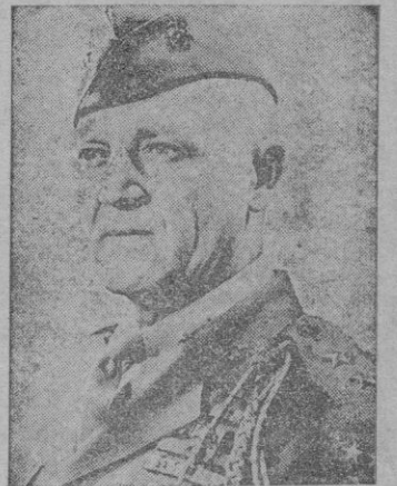
El general de división Graves D. Erskine, que manda la Primera División de Infantería de Marina de los Estados Unidos

ATAQUES RECHAZADOS Tokio 18. — El comunicado de medianoche del Cuartel General del General Mac Arthur, dice que los comunistas han sido rechazados muy atrás de Changyon por la Infantería de Marina y la 24 División de los Estados Unidos. — (Efe).