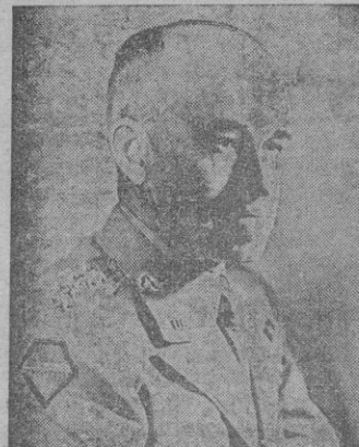
El general Omar N. Bradley, presidente de la Comisión Mixta de Jefes de Estado Mayor del Ejército norteamericano

Nueva York 18. — Refiriéndose a la actitud contraria al empréstito español tomada por el senador demócrata K. Lehman, el veterano jefe republicano Hamilton Fiss, al anunciar que presentaba su candidatura en noviembre para senador por el Estado de Nueva York, declaró: "El voto del senador Lehman en contra de España tiene que haber regocijado al poliburo y a los comunistas y simpatizantes suyos en el mundo entero. Los comunistas apoyan cuanto se hace por debilitar y empeorar nuestras relaciones con España. Hay que dar a España pleno reconocimiento diplomático y si se me elige senador por Nueva York haré cuanto pueda por restablecer estas relaciones y por la concesión de préstamos". — (Efe).