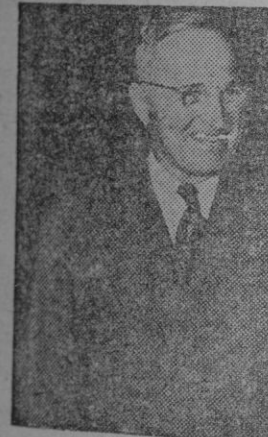
CHIANG-KAI-CHEK y TRUMAN