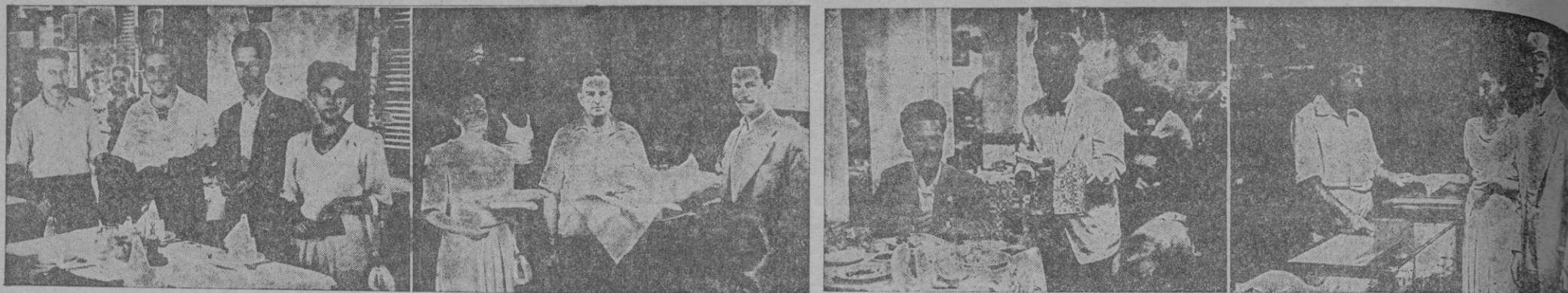
La dichosa pareja después de la excursión al Torrent de Pareys. Con ellos el dueño del "Marisol" y de la embarcación "La Peña". — La foto demuestra las proporciones poco corrientes de la ensaimada de Ca'n Xim Tambora. — Cenando en el "Marina", el excelente hotel del Puerto de Sóller. — El primer obsequio del día donado por "Establecimientos Victoria".