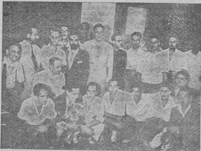
Los piragüistas del S. E. U. durante su visita a BALEARES

Si para nuestros camaradas del Sindicato Español Universitario comienza hoy el riesgo y la gloria de un esfuerzo español y católico, para la Patria entera y casi para el mundo, ha de empezar, con su primer golpe de remo, una teoría sinceramente honda de inquietudes y deseos de triunfo. Gentes de todas las latitudes han de estar pendientes de la noticia que se luz sobre esta audacia tan temerariamente hispánica, y a los mallorquines ha de cabernos el honor de que haya sido esta tierra, la que abriera las etapas durísimas, agotadoras, que han de jalar este camino que también lleva a Roma por la ruta virgen del mar, para rendir allí toda la bizarria de su gesto, toda la arrogancia viril de su empeño y toda la tensión de sus músculos y el latir de sus corazones a los pies del Papa, en gesto humildísimo de cristiano.