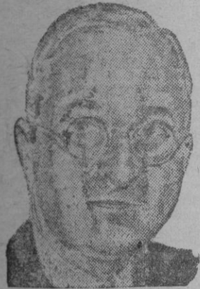
TRUMAN Opina y falla

Realmente, en una comprobación vista de actitudes, la política mantenida por Washington con relación a España, justificaría bien claramente las últimas palabras de Pleger. Mas en el mundo de los errores y de la danza de las pasiones, Norteamérica fué en cabeza. Mr. Acheson pudo equivocarse y equivocarse. Reminiscencias presidenciales pueden todavía quedar, mas suponemos irán desapareciendo. Bueno es que el Senado se manifieste a favor de España por 65 votos contra 15 y que toda la prensa, los comentaristas y la mayoría del