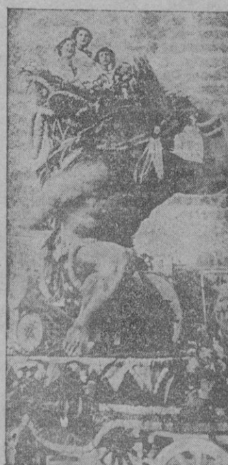
Valencia. — "Esclavo", carroza que obtuvo el segundo premio en el desfile celebrado en el paseo de la Alameda con motivo de la batalla de flores, último festejo de la feria valenciana