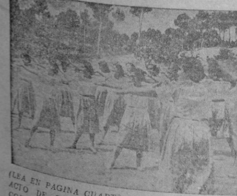
LEA EN PAGINA CUARTA AMPLIA RESEÑA DEL ACTO DE CLAUSURA CELEBRADO ANTEAYER CORRESPONDIENTE AL TURNO FEMENINO DEL ALBERGUE