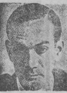
CAMILO JOSE CELA

El azar se rige por leyes —las "Leyes del azar", figura poética— que ignoramos concienzudamente. El cálculo, por el contrario, se guía por las leyes que los hombres sabemos porque somos quienes las han —o las hemos— inventado. Pero el cálculo sin el azar —esa última chispa de gracia, ese ángel que vuela para nuestro deleite y para nuestro provecho— no lleva a ningún lado.