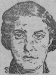
PILAR PRIMO DE RIVERA

Madrid 14.— En el despacho del Ministro de Justicia y Secre- tario General del Movimiento, le fueron, ayer tarde, im- puestas a la Delegada Nacional de la S. F., Pilar Primo de Rivera, las in- signias de la Gran Cruz de Isabel la Católica, que le han ofrecido los jefes provinciales del Movimiento de toda España.