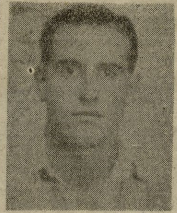
CLADERA figura del partido

La entrega de balones por los medios volantes, es también más (continúa en la pág. siguiente)