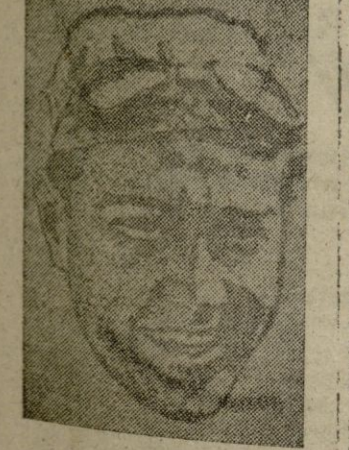
POBLET dominó y venció en la carrera

Consistió la prueba en 43 vueltas al circuito, con un recorrido