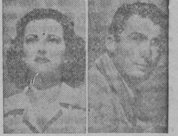
Joan Bennett y Gregory Peck

(Astoria y Avenida) Lo que resulta más interesante de este film es la penuria de medios con los que ha sido construido. Zoltan Korda, con apenas tres intérpretes, un pedazo de campo y unas escenas —de evidente documental— con animales salvajes corriendo, nos entrega un cine-drama que resalta intrínsecamente hasta que, por sus escenas finales, defrauda al quedar, lógicamente, pendiente de final. O, mejor dicho, pendiente del fin que el espectador le quiera colocar.