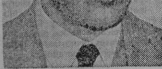
PANDIT NEHRU sólo quiere trigo

Probablemente, la cruda franqueza y en la opinión norteamericana, gran desilusión en las esferas oficiales y en la opinión norteamericana, Y, sin embargo, esa actitud de los indios será una de las pocas actitudes lógicas que, en el campo de la política internacional, se hayan adoptado desde hace algunos años. Si la rivalidad entre Rusia y los Estados Unidos se considera trivialmente como una simple lucha entre dos Potencias igualmente ambiciosas por alcanzar la hegemonía mundial, ¿qué les va ni qué les viene a los trescientos millones de compatriotas del pandit Nehru en semejante conflicto? Y si se tratara —como desgraciadamente ocurre en realidad— de una dramática pugna entre la civilización occidental y una doctrina siniestra que la quiere destruir para implantar un sistema totalmente nuevo sobre sus ruinas, ¿por qué han de acudir los indios en defensa de una civilización que no es la suya?