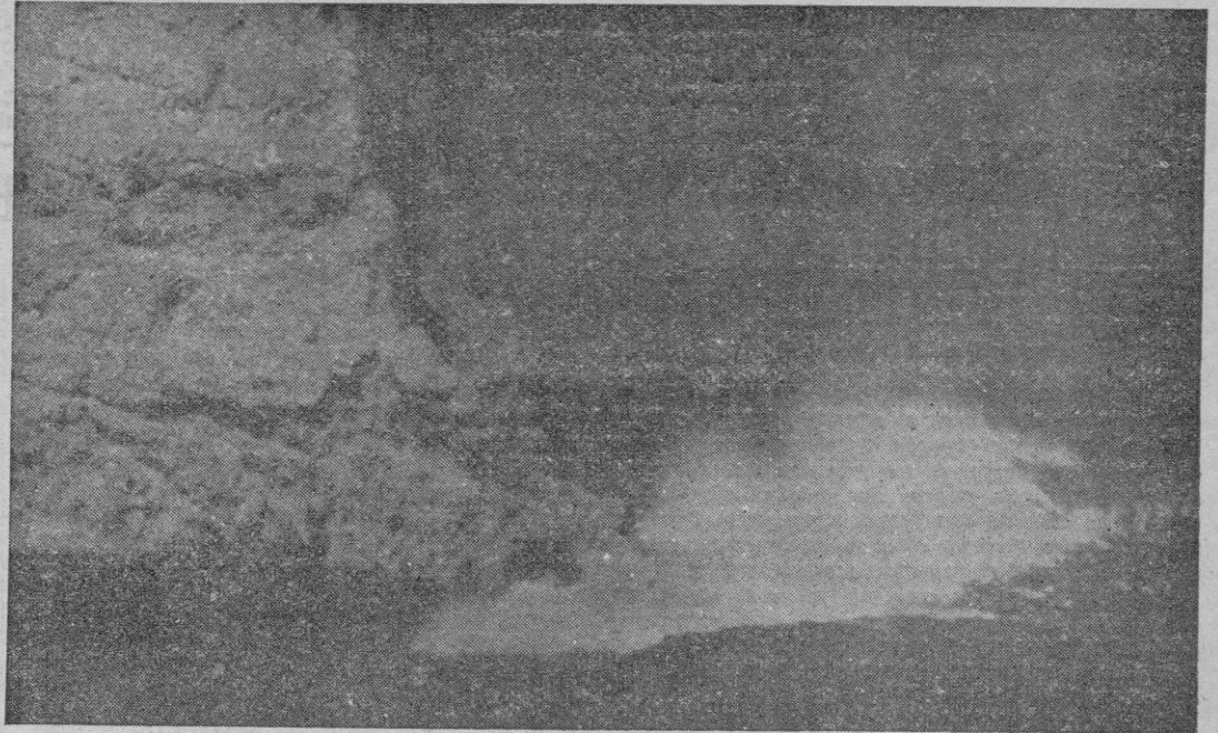
AMPLIA INFORMACION Y REPORTAJE GRAFICO DE «JUANET» EN PAGINA 5.

Siete mil metros cúbicos de roca fueron destruidos