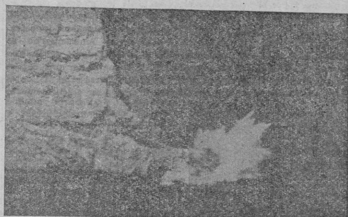
El momento de la explosión de «Punta Troneta»

Se inicia el descenso. La caravana de coches —otra vez revuelto de matrículas lejanas—, desciende envuelta en columnas de polvo, y siembran la carretera centenares de sombreros pajizos y espaldas quemadas de sol. Hay en