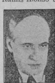
Ortega y Gasset