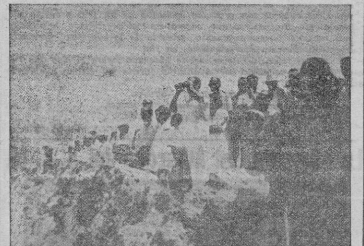
El público, desde «La Atalaya», presencia el espectáculo

gos, y pañuelos multicolores en las cabezas femeninas. Hay una corriente fraterna de comprobación de relojes, un mucho de expectación y un poco de incertidumbre y hasta de miedo. Se habla de hondas expansivas, y de toda esa retahíla bélica que aún perdura, fresca y vivida, en la memoria.