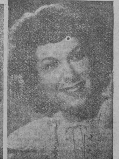
MARIBEL ROYO Estrella de la canción

GRAN EXITO DE Rosa de Málaga - Maruja de Andalucía - Dorita de Andalucía - Maruja de Sevilla Genial canzonetista Estrella de la canción Vocalista Canto y baile