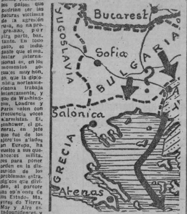
El camino hacia Salónica vuelve a ser foco candente

Agitación en Italia frente al Pacto Atlántico; campaña de la prensa soviética contra Finlandia y Noruega; concentraciones de tropas búlgaras sobre las fronteras septentrionales de Macedonia, motivos suficientes, entre otros, para que la tensión internacional aumente y para que en las conferencias se baraje una vez más la hipótesis de la posible agresión soviética, ya en el Norte contra el país finlandés, y la península escandinava, bien en el Sur, contra Grecia y Turquía. No parece, sin embargo probable, al menos por ahora, que la U. R. S. S. se decida al ataque franco. Moscú no tiene todavía a punto sus medios ofensivos, y la labor que el comunismo realiza en los países que podrían ser las futuras víctimas de la agresión rusa, no ha progresado, por otra parte, bastante. En todo caso, es indudable que el mal estar internacional es, en los momentos actuales muy honroso, que la diplomacia norteamericana trabaja intensamente, y que de Washington, Londres y París salen con frecuencia voces alarmistas. El general Eisenhower, en jefe de los ejércitos aliados en Europa, ha vuelto a sus quehaceres militares para poner orden en la discusión de los problemas estratégicos que dividen, al parecer las opiniones de los Estados Mayores de Tierra, Mar y Aire estadounidenses, y con Eisenhower se ha reintegrado también a sus funciones castrenses de altos vuelos, el general Spaatz, defensor prestigioso y carter del empleo de la moderna aviación militar.