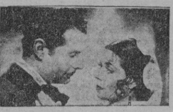
Una escena de la película.

Y doblemente interesante el film, no sólo por su calidad cinematográfica, sino por el tema tratado: una muy bien hecha biografía del músico español Isaac Albéniz.