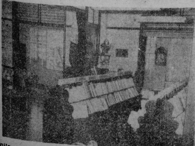
Manila. — Una vista de la sala donde se celebra la Exposición

INAUGURACION DE LA PRIMERA EXPOSICION DEL LIBRO ESPAÑOL CONTEMPORANEO EN FILIPINAS