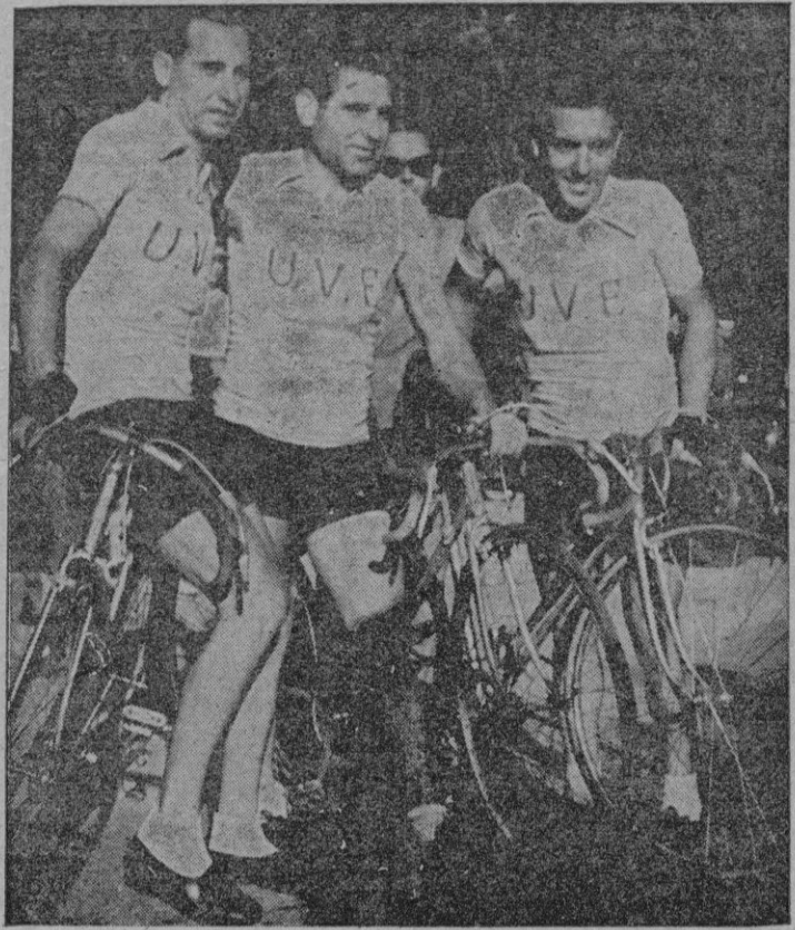
Madrid. — El equipo balear, poco antes de iniciarse la gran prueba ciclista en la que se clasificó en tercer lugar.