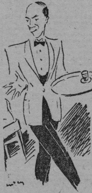
«El barman me habla pestes de Rusia, de Stalin y de los comunistas...»

de Europa de ayer y de hoy, que ya huele a Hollywood. Alredor del navio—como en el remoto Haway de las perfumadas piñas