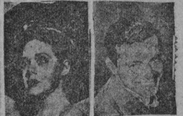
Alice Faye y Dana Andrews

Alice Faye hace de ángel bueno en la cinta y Dana Andrews, con su característico modo de hacer, hace de víctima propiciatoria de un mal amor, por el que delinque y engaña.