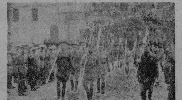
Santiago de Compostela.—Desfile de los abanderados con los estandartes de los Regimientos de Caballería que forman la peregrinación nacional del Arma ante las Autoridades.