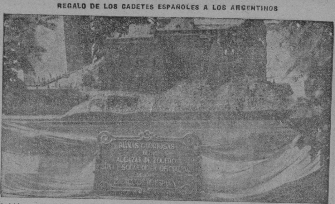
Madrid. — Maqueta de las ruinas del Alcázar de Toledo, que los cadetes españoles regalan a sus compañeros los cadetes argentinos, que se encuentra expuesta en uno de los patios del Ministerio del Ejército.

Lake Success 30. — El jefe del Grupo de la Comisión de la O.N.U. para Palestina destacado en este país, que acaba de llegar a los Estados Unidos con el fin de informar a la Comisión declaró ante ella que al terminarse el mandato británico, el mes próximo, estallará una guerra de envigadura. Dijo también que la partición es un hecho y que resulta imposible destruirla, habiéndose ido en ella incuso, más allá de lo que se quería, pues la partición afecta también hoy a Jerusalén, que según la Asamblea General de la O.N.U. había de quedar indiviso bajo su régimen especial. Manifestó igualmente que el ejército judío está bien organizado y bien abastecido y que las relaciones entre el grupo de la O.N.U. y los judíos son excelentes mientras que no existen entre dicho grupo y los árabes. «Entre tanto la Comisión para Palestina está negociando con el Consejo de Alimentación de Urgencia de Washington, la continuación de sus suministros a Palestina y con la Unión Postal Universal el mantenimiento de las comunicaciones con Tierra Santa hoy unida exclusivamente por telégrafo con el resto del mundo. — Efe.