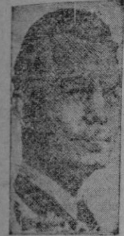
J. FORRESTAL. El hombre de acción que ocupará el Ministerio de la Guerra de Washington.

Aunque pocas autoridades de ninguno de los dos países considera inmediata una crisis, la obligación de los militares es hallarse preparados para cualquier eventualidad, a cuyo efecto ultimán los auxilios preparativos. Las conversaciones comenzaron en la capital de los Estados Unidos a primeros del mes de abril con motivo de una visita que efectuaron expresidente a Washington varios peritos ingleses de Defensa, presididos por el jefe del Estado Mayor del Ministerio británico de la Guerra.