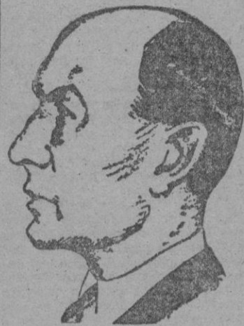
ROBERT A. LOVETT

Como resultado de la entrevista entre Inverchapel y Lovett se cree que existe la posibilidad de que sea presentado un plan al Congreso norteamericano para incorporar en la nueva alianza