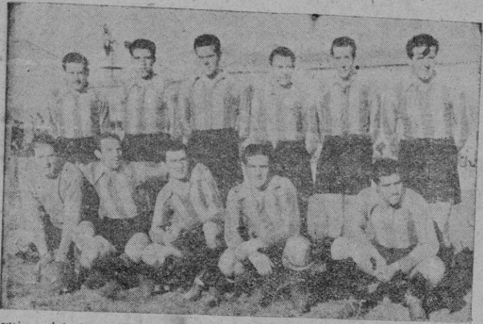
Equipo del San Andrés, que al vencer al Atlético Baleares se adjudicó los dos puntos en litigio.