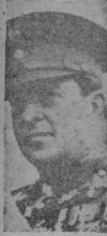
REY PABLO un quiste en el expansionismo soviético

Los acontecimientos siguen su curso normal y la definición de campos, tras el consiguiente nerviosismo, se puntualiza cada día con mayor precisión. Sin embargo, dos síntomas contradictorios han asomado en las cuarenta y ocho horas pasadas. Uno, pesimista, de gravedad por lo que pueda representar en un posible juego político posterior. Otro, optimista, aunque no vaya más allá de una esperanza unilateral. Estos síntomas proceden de la formación de un «Gobierno guerrillero griego» por el llamado «general» Markos y de los sondeos británicos —recibidos «sin disgusto» en Moscú— para evitar que el fracaso de la Conferencia de Londres sea una trinchera definitiva entre yanquis y rusos.