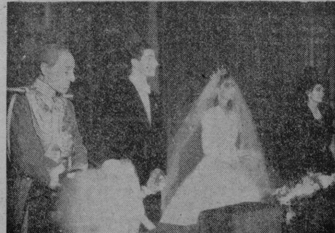
Un momento de la aristocrática boda, que tuvo lugar en la Catedral de Sevilla.