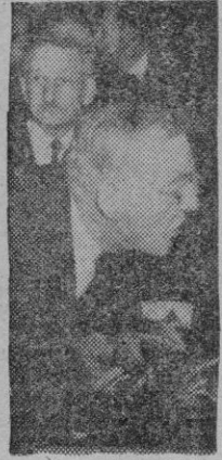
H. JOHNSON los norteamericanos se han lanzado al ruedo palestino.

mir la responsabilidad de imponer la política que sostienen frente a la oposición con la cual, sin ninguna clase de dudas, se tenga que tropezar. No puede decirse que la declaración estadounidense haya alentado las esperanzas de los que creen que la inminente retirada británica tenga que inducir a los árabes y judíos de Palestina a estudiar los medios para evitar una explosión que resultaría desastrosa para ambos. Esta esperanza es, de todos modos, débil. Podría realizarse tan sólo si las comunidades rivales se hallaran frente a la determinación de una gran potencia como los Estados Unidos de aplicar una decisión si es necesario al precio de su propia sangre y de su propio dinero, juntamente con las otras potencias que opinan de igual modo. Si verdaderamente existiera aún en algún sector la creencia de que Gran Bretaña permanecería por más tiempo en Palestina, este error habrá sido disipado por la seria advertencia dada por el Alto Comisario británico en Jerusalén el pasado martes. Es evidente que el pueblo británico ha tomado una determinación de una vez para siempre. Y a menos que las Naciones Unidas ofrezcan a la vez un plan y el organismo internacional encargado de aplicarlo, este país puede y debe realizar sus declaradas intenciones de salir de Palestina».