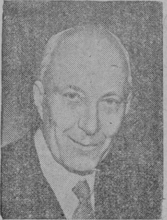
DALTON Un ministro de Hacienda en apuros

El discurso pronunciado por Mr. Ernest Bevin en el Congreso de los Sindicatos británicos, reunidos en Southport, ha sido recibido, como se esperaba y advertía el Ministro inglés en su parlamento, con desagrado en los Estados Unidos. La alusión al sistema yanqui de acaparar el oro y evitar una redistribución del mismo, no es nueva. El antiguo Ministro de Economía alemana durante el crecimiento del III Reich, había expuesto teorías parecidas. Todas las naciones pobres del Mundo, sin más que descubrir y menguadas reservas del precioso metal, abundan en ese sentido. La opinión de Mr. Bevin no es más que una posible realidad en las presentes circunstancias económicas del Mundo y la confesión de que la Gran Bretaña ha entrado en el concierto de esas naciones pobres.