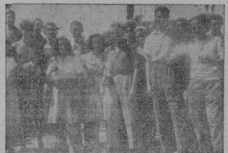
Los vencedores en las diferentes categorías, con los Trofeos conquistados