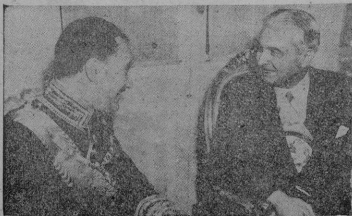
Bogotá.—El nuevo Ministro de España en Colombia, don José María Alfaro, conversa con el Presidente de la República, señor Ospina Pérez, después del acto de presentación de Cartas Credenciales.