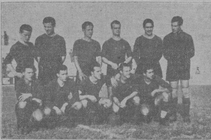
Equipo del C. de F. Barcelona.

ALINEACIONES Y GOLES A las órdenes del señor Florit, que tuvo algunos fallos en