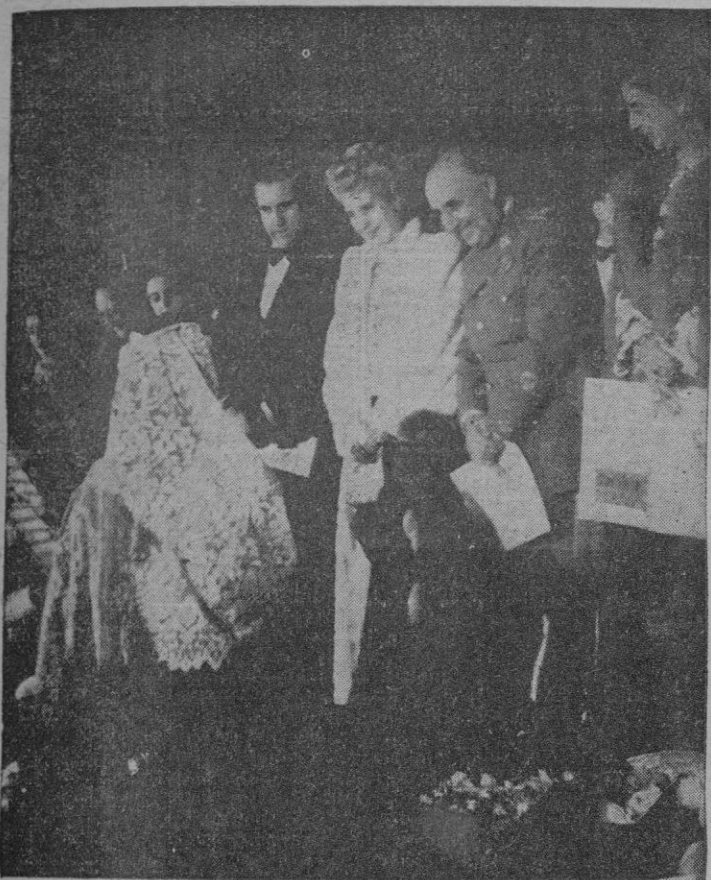
Madrid. — La ilustre dama esposa del Presidente argentino, acompañada de S. E. el Jefe del Estado y su esposa y ministros y personalidades, durante el homenaje de las provincias españolas a doña María Eva Duarte de Perón en la Plaza Mayor de Madrid