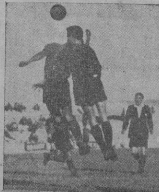
Lea en nuestra página deportiva: Barcelona, 3—Mallorca, 0. La Vuelta Ciclista a Mallorca. Semana náutica en Ibiza.

Toledo.—A las doce de la mañana el comercio ha cerrado sus puertas y se paralizaron las actividades de la capital, para que todo el vecindario pueda sumarse al recibimiento de doña María Eva Duarte de Perón, esposa del Presidente de la República Argentina, a quien acompañará la esposa del Jefe del Estado, doña Carmen Polo de Franco.