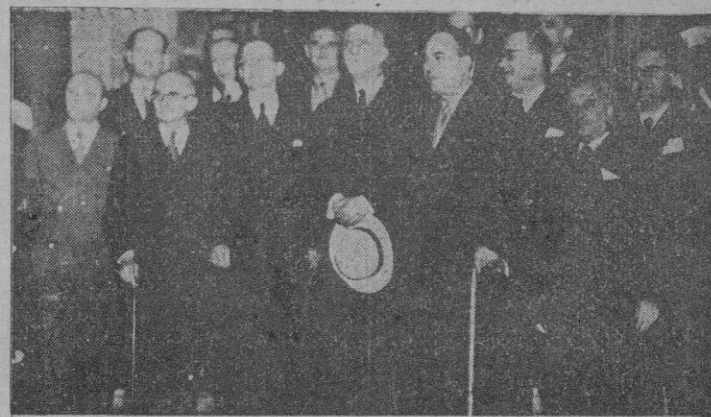
Roma. — El IV Gabinete de Gasperi momentos después de haber prestado juramento al Presidente de la República.

“El prestigio del Caudillo es cada día mayor”