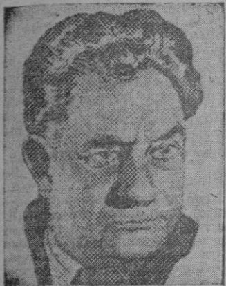
DIMITROFF un fiel criado del Kremlin

Según nuestro corresponsal en Nueva York, preocupa hondamente allí la situación europea, y el Gobierno yanqui se dispone a abordar el problema de la rehabilitación del viejo Continente considerando al mismo en bloque y no por naciones aisladas como efectuó hasta ahora. Se trata de organizar económicamente una gran zona anticomunista con los pueblos situados al oeste del telón de acero, y vigorizarla con inyecciones de capital calculadas en dinero oscilan entre los 6.000 millones de dólares anuales. Crean que la prosperidad de este bloque traerá como consecuencia la quiebra de los regímenes prosoviéticos que se desmenuen dentro de la órbita del rublo.