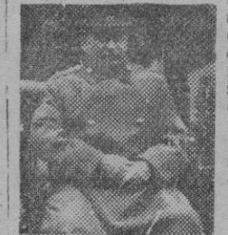
STALIN un Hitler con un bigote más largo

En su afán de arrojar tango y desorden a lo alto del espacio nazi, antes, durante y después de la guerra, Rusia omitió que por ley de gravedad, ese mismo fango iba a caer más tarde en la cara. La misión dialéctica y argumentista de aniquilar el totalitarismo alemán no podía en buena lógica corresponder al totalitarismo ruso sin que en alguna forma éste pagase luego las consecuencias. Aquella era función exclusiva de las democracias. Y esto es precisamente lo que ahora está ocurriendo. La saga implacable de propaganda antinazista que Rusia contribuyó con los angloamericanos a tejer para estrangular al nazismo, es, sin especial innovación alguna, la misma que los angloamericanos utilizan ahora, primero para sujetar al desmandado totalitarismo soviético, y andando el tiempo, si es posible estrangularlo también. Para los angloamericanos la tarea está siendo relativamente fácil en orden a las palabras donde durante la guerra se escribía Hitler, Alemania, nazismo, y está escribiendo ahora Stalin, Rusia, comunismo y la descomunal masa de argumentación antinazi se mantiene así, enteramente válida y sin desperdicio alguno para el antisoviétismo y el anticomunismo, ahora tan en boga y en pleno desarrollo en Inglaterra y en Norteamérica. Dos años después de vencida Alemania, el nazismo ruso está empezando a sufrir en el mundo angloamericano las consecuencias de su antinazismo germano.