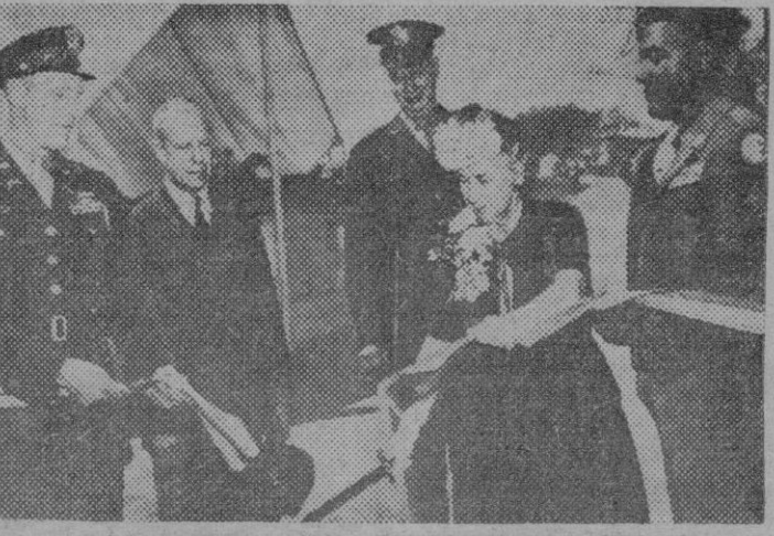
Arlington (Virginia, EE. UU.). — En el cementerio nacional norteamericano de Arlington, ha sido inaugurado un nuevo paseo que lleva el nombre del fallecido general George S. Patton. En la fotografía, la viuda del general Patton, corta la cinta, con una bayoneta, en presencia del secretario de la Guerra, Patterson (segundo de la izquierda) y algunos oficiales del Ejército.