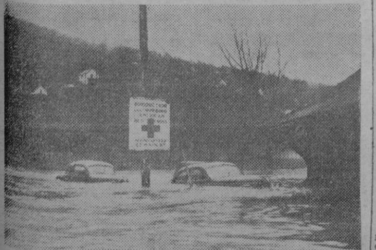
Bradford (Pensilvania, EE. UU.). — Vista de la estación ferroviaria del pueblo de Bradford, el cual ha quedado totalmente inundado, como consecuencia del desbordamiento de numerosos riachuelos.