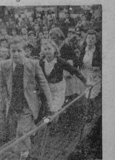
Una expedición de niños polacos subiendo al «Ciudad de Valencia», al regresar a su patria después de la estancia en España debidamente atendidos en los Hogares Infantiles de Barcelona.