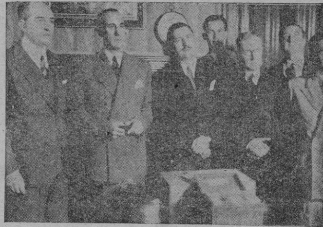
El Ministro de Agricultura Sr. Rein Segura, con el Director General de Montes de la Argentina Sr. Tortorillo y otras personalidades, durante el intercambio de semillas de los dos países celebrado en el despacho del Ministro.

INTERCAMBIO DE SEMILLAS ENTRE ESPAÑA Y LA ARGENTINA