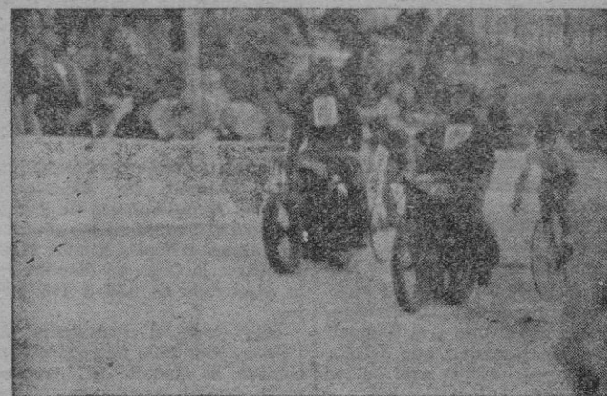
Momento impresionante en que Timoner I rebasaba a Salom, que más tarde se retiró por avería justificada en los rozamientos de la máquina