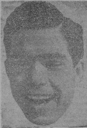
BRAVO, del Barcelona

Se inició ayer el despacho de entradas y localidades para los tres encuentros, así como también el despacho de abonos para los tres partidos. La demanda es tan enorme, que nos aventuramos a afirmar, que el campo de Es Fortí, habrá de resultar insuficiente para albergar tanta afición. Lo presuñamos... un poquitín. No siempre se dan casos de poder ver un Barcelona y un Atco. de Bilbao frente a frente, de competición.