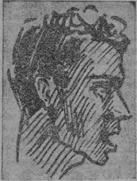
Cetino, de C. N. Palma que el sábado pasado por su brillante actuación fué muy aplaudido.