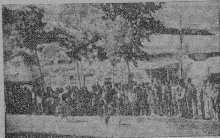
Un momento de la carrera ciclista «Vuelta a Palma»