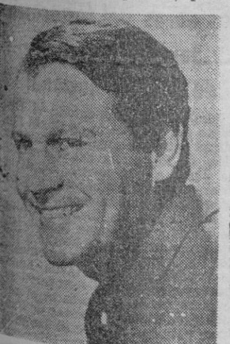
JOEL MC. CREA

no hay duda que habría alguna otra clase de hombres y mujeres, y a éstos, quien más quien menos, ya nos los sabemos de memoria. Y este es—que el argumento sea de T. B. O., con lo reparo serio que se le puede hacer a «Unión Pacífico». Y no sería reparo porque pacíficamente para todos los que no ingenuidad — será una de las grandes cualidades del film que, tiene a su favor. Fundamentalmente B. de Mille idea de una gran y completa historia de la construcción de esa guerra de secesión, el At. lo muy espectacular nos relata unos cuantos episodios que, en Tales son el desarrollo de los días del tren en el ataque de los indios, la construcción de un puente, el paso que las vías del tren por caminos de búfalos, las escenas milas. Junto a esas masas donde los intérpretes (hombres y máquinas) corre la pequeña historia amorosa y aventurera de los protagonistas, servidos por in-