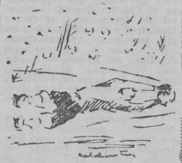
Ramallets hizo el milagro de evitar un gol inevitable.