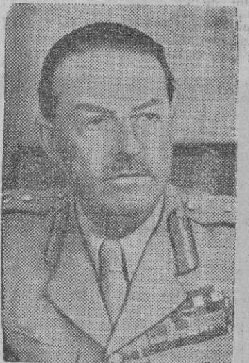
La más reciente fotografía del Mariscal británico Sir Harold Alexander, que fué hasta ahora el Comandante Supremo Aliado en el Mediterráneo y que acaba de ser nombrado Gobernador General del Dominio del Canadá