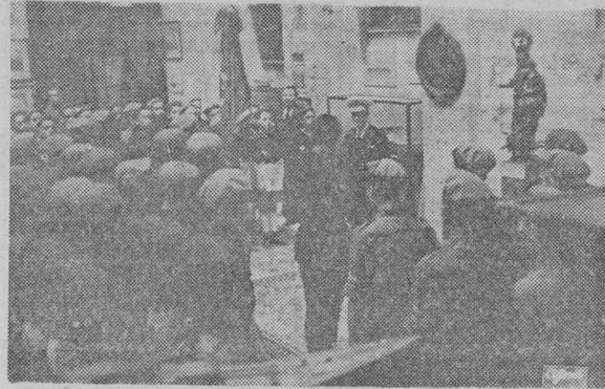
En el Museo Naval de Madrid la centuria del Frente de Juventudes «Lepanto» ofrenda cinco rosas a la Virgen del Rosario.