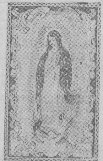
Nuestra Señora de Guadalupe, imagen que se venera en Hispanoamérica

por bárbaros y herejes; pero todos los intentos de mal se han estrellado contra la Sagrada Columna. «Renazca España en Zaragoza —decía Peñafof, el hé-