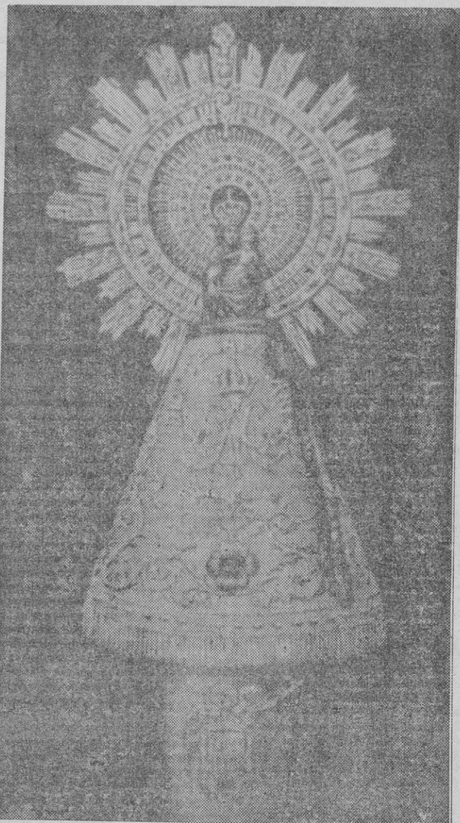
LA VIRGEN DEL PILAR