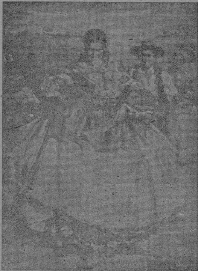
N. Puget. — «De la fiesta».

La Exposición que el Maestro Narciso Puget realiza actualmente en las «Galerías Costa» no envuelve el propósito de señalar una etapa renovadora en su carrera artística, solidamente cimentada por el éxito.