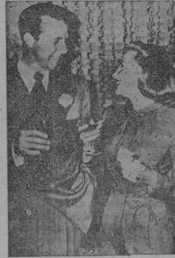
En la fotografía aparece el popular actor del cine americano con su nueva esposa June Allyson, de 21 años brindando por su felicidad después de la boda.