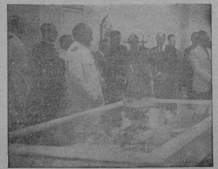
Nuestras autoridades en el acto solemne de la inauguración (Vea información en página 3.ª)