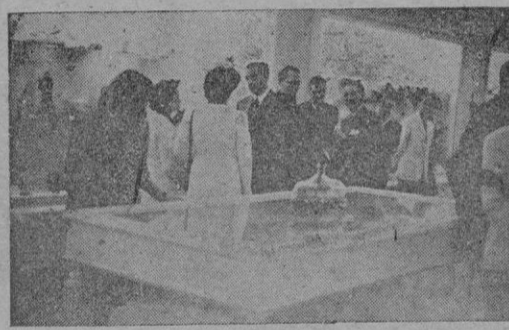
Asistentes al acto contemplan las obras expuestas