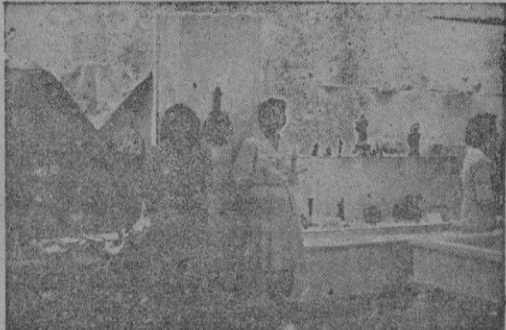
Un detalle de la Exposición Permanente