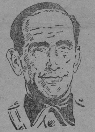
El General Muñoz Grandes, nombrado Capitán General de Madrid