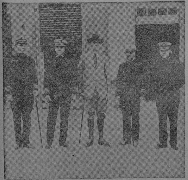
El Presidente Roosevelt, una autoridad en historia naval, coleccionista de modelos de barcos, pescador entusiasta y amante del mar, sirvió a su país como Subsecretario de la Marina de los EE. UU. de 1913 a 1920. Aquí lo vemos con un grupo de oficiales de la Armada, en la gran base naval de Loriente, durante la pasada guerra.