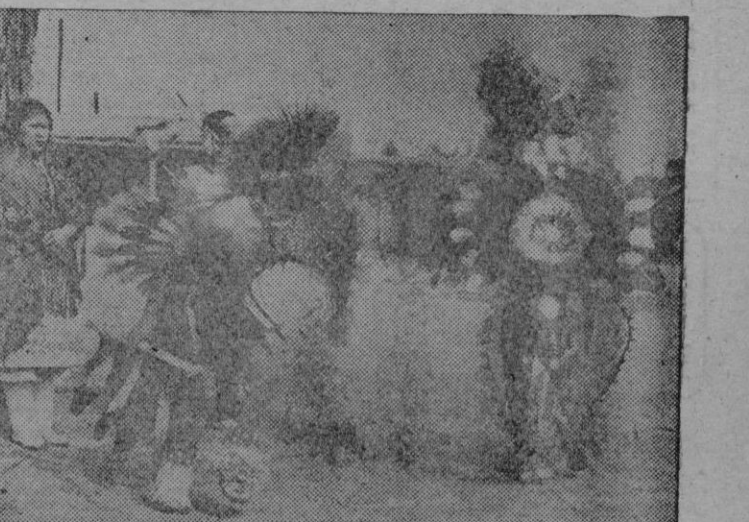
Miembros de la tribu de los Indios Jemez, del Sudoeste de los Estados Unidos, ensayando su «Danza de los Escudos», para el Festival Popular que se celebra anualmente en América.