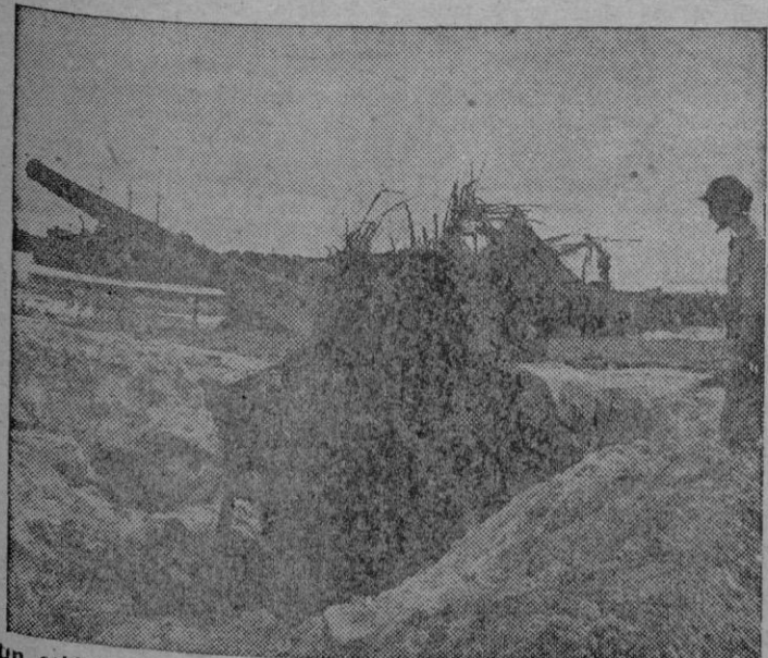
Un soldado americano contempla un cañón japonés que, no obstante su camuflaje, fué puesto fuera de combate antes de poder disparar, durante las operaciones de desembarco americanas en la isla de Biak, al Sudoeste del Pacifico.

Antes de fin de año, nueva conferencia interaliada