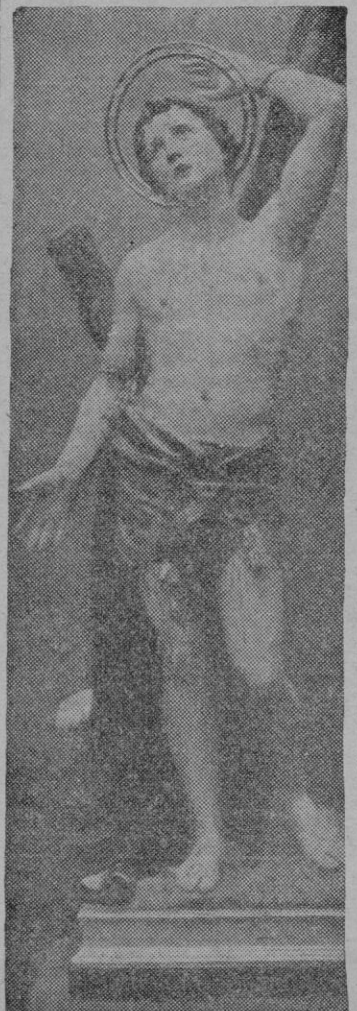
Hoy celebra Palma la fiesta de su Santo Patrón con solemne y tradicional función religiosa en la que es adorada la sagrada reliquia del brazo, que se conserva en nuestra Catedral.