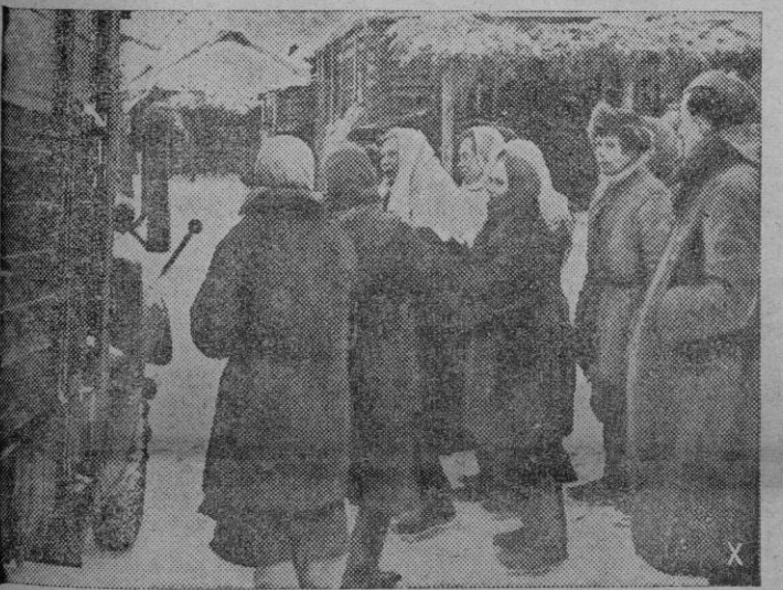
La población rusa casi en masa ha seguido al Ejército alemán en sus repliegues actuales. Aquí vemos a un grupo familiar al llegar a su punto de destino en la retaguardia ocupada por los alemanes

La población rusa sigue al Ejército alemán