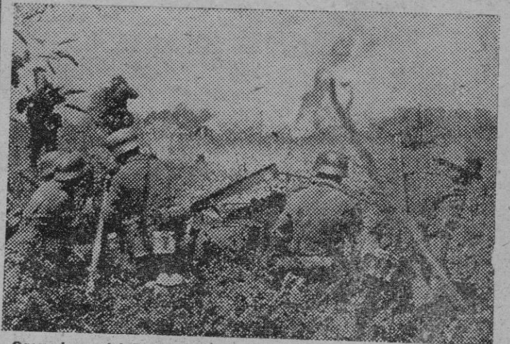
Granaderos del Reich castigan duramente con su certero fuego las posiciones soviéticas del sector.