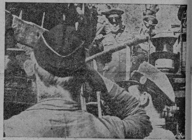
En su visita a la costa atlántica el Teniente General Oshima, Embajador nipón en Berlín, tiene ocasión de saludar a unos submarinistas alemanes que regresan de una acción contra el enemigo.