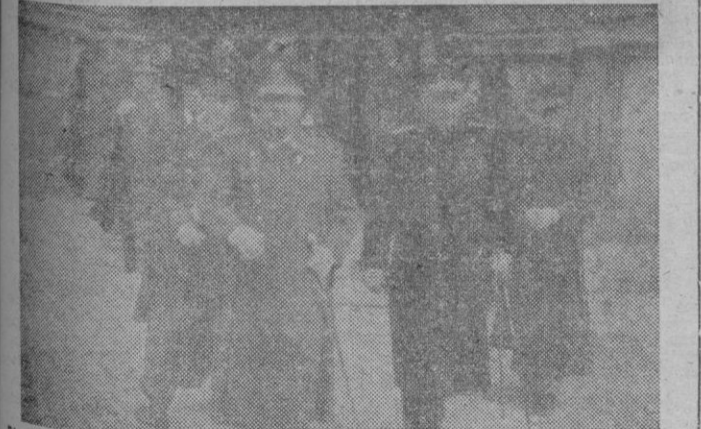
El Excmo. Sr. Capitán General de Baleares, con el Contralmirante Jefe de la Base Naval y el Jefe de la Región Aérea, a su salida del templo de San Francisco

En pag. 7 información de los actos celebrados con motivo de la Festividad de la Patrona de la Aviación