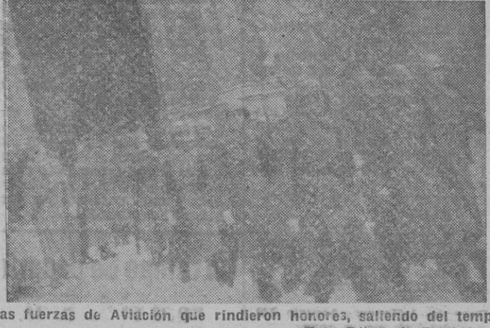
Las fuerzas de Aviación que rindieron honores, saliendo del templo

imagen de Nuestra Señora de Loreto respaldada por un artístico repostero con el escudo de España. Una ametralladora anti-aérea y un cañón antitanque y diversas armas artísticamente colocadas formaban un magnífico conjunto. Una escuadra de guardadores daba guarda de honor.