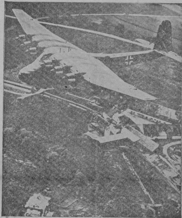
El «Gigante Me 323» en pleno vuelo.

dera revolución del transporte aéreo, la absoluta conquista de esa fantástica navegación por el espacio, que, cuando llegue el día de las hostilidades, unirán a todos los hombres, elevando, muy por encima de la elevada altura