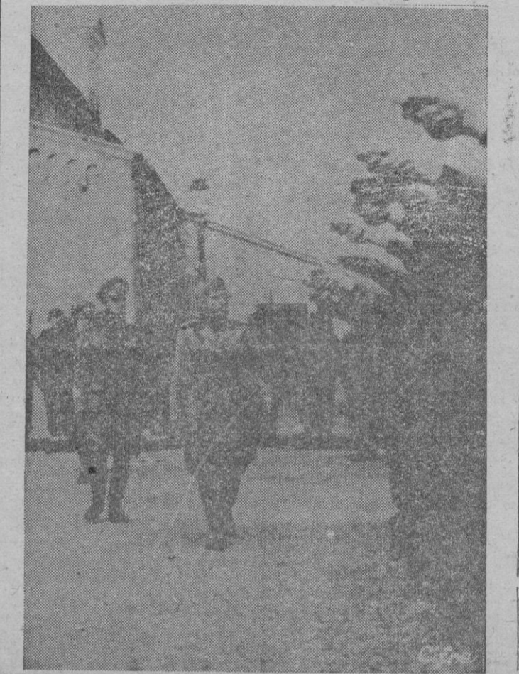
En un lugar de la Italia del Norte, el Jefe de la República Social Fascista pasa revista a un grupo de Legionarios «Camisas Negras» antes de partir para el frente