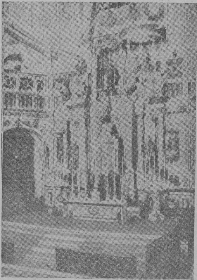
El bellissimo Altar Mayor de la iglesia de San Francisco