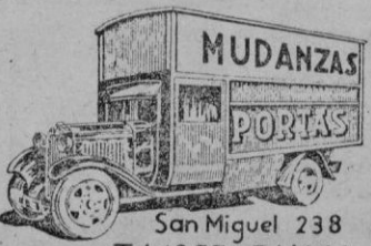
San Miguel 238 Tel. 1257 PALMA

PARA EMBALAJES Y TRASLADOS A LA PENINSULA LA PIVA PRECIS A: