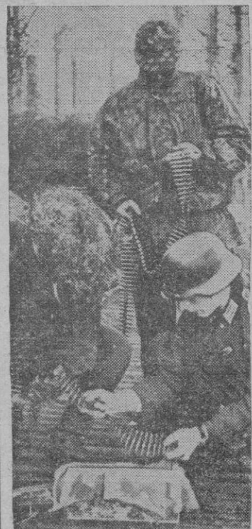
En los intrincados bosques de la Rusia septentrional las fuerzas alemanas de asalto hostilizan eficazmente a los soviets. Para ser confundidos con el terreno, usan el indumento que vemos en la foto.

Berlin (Urgente). — Jitomir ha sido reconquistada por las fuerzas alemanas. Tropas del Reich habían cercado la ciudad y conquistaron importantísimo botín de armas, especialmente de carros y piezas de artillería. El número de prisioneros es muy considerable y todavía no se conoce con exactitud, en estos momentos. — (Efe).