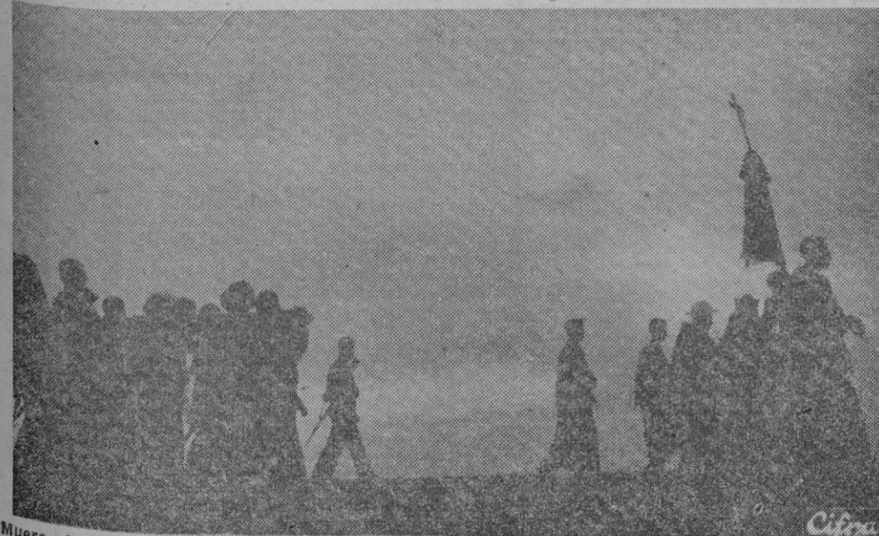
Muere el día, y la comitiva fúnebre continúa su caminar por las rutas de España José Antonio marcha hacia su tumba.

EL CAMINO A las dos de la madrugada del 21 se cumple la primera etapa: Elda. Cada diez kilómetros se relevan las milicias de cada provincia que con sus jerarquías al frente le dan guardia. Al