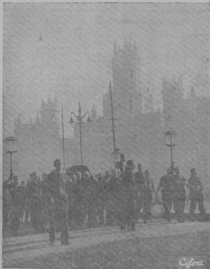
El entierro de José Antonio a su paso por las calles de Madrid

jo funerario. Las escuadras jóvenes llevan sobre sus hombros el cuerpo de su Capitán. Primero el paisaje es dulce y mediterráneo; después vendrá la encrucijada para morir en la marea de la Mancha.