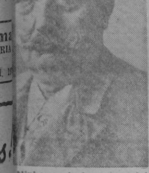
Nipkow, el inventor del disco de televisión

alidad no es ni la una ni pero la segunda respues- aproximaría mucho más a