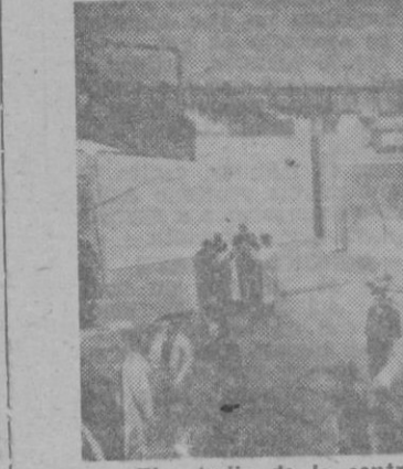
El estudio de la central de televisión alemana

existiendo puestos de telefonovi- sion desde los que pueden nor- malmente sostenerse conferen- cias como si se tratara de una corriente comunicación telefóni- ca, pero con la diferencia de que los interlocutores, aunque estén separados por una distancia de muchos kilómetros, pueden verse al mismo tiempo que se hablan.