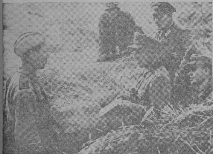
En un sector del frente del Este un prisionero ruso hace sus primeras declaraciones en un puesto de mando alemán de vanguardia