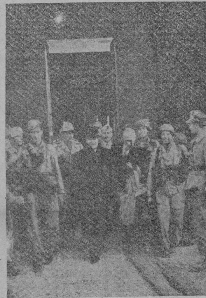
Momento de salir Mussolini del hotel donde estuvo secuestrado.