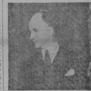
Publicamos hoy la fotografía del conocido diplomático norteamericano, Summer Welles, que ha dimisionado recientemente de su cargo de Subsecretario de Estado americano. En su último viaje a Europa visitó España.