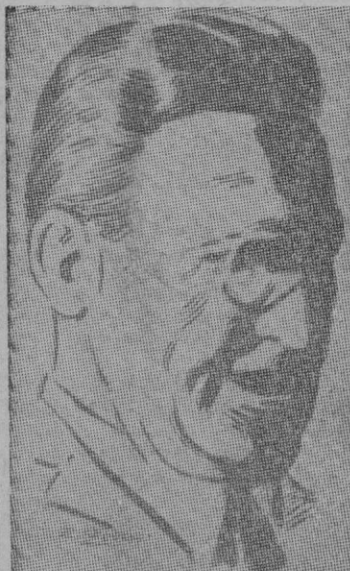
El Mariscal Rodolfo Graziani, conocido soldado africano, que acaba de ser llamado por Mussolini para ponerle al frente de la Defensa Nacional y de la Subsecretaría de Guerra del nuevo Gobierno republicano fascista.