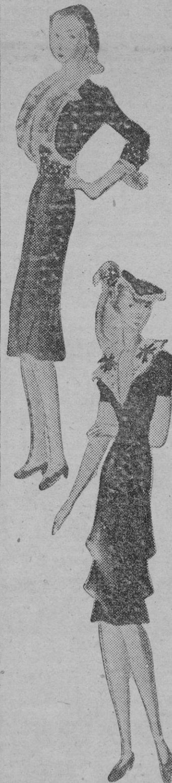
Dos lindos modelos de los creadores italianos