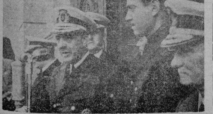
El Ministro de Marina dirigiendo la palabra a la multitud durante el homenaje a la Marina recientemente celebrado en La Coruña