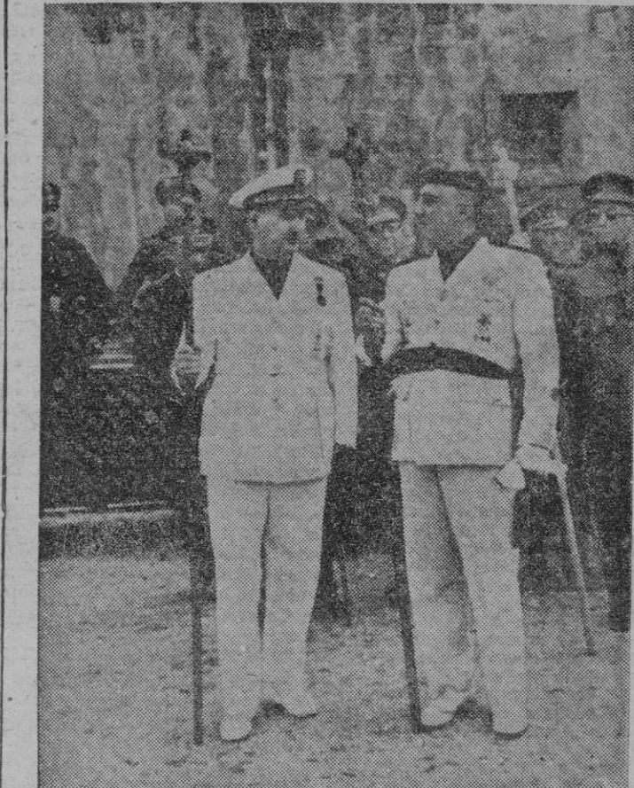
El Caudillo, con el bordón de peregrino, acompañado del ministro secretario general del Partido, momentos antes de ponerse al frente de la peregrinación de la Falange, presidiendo la cual rindió homenaje al Apóstol Santiago