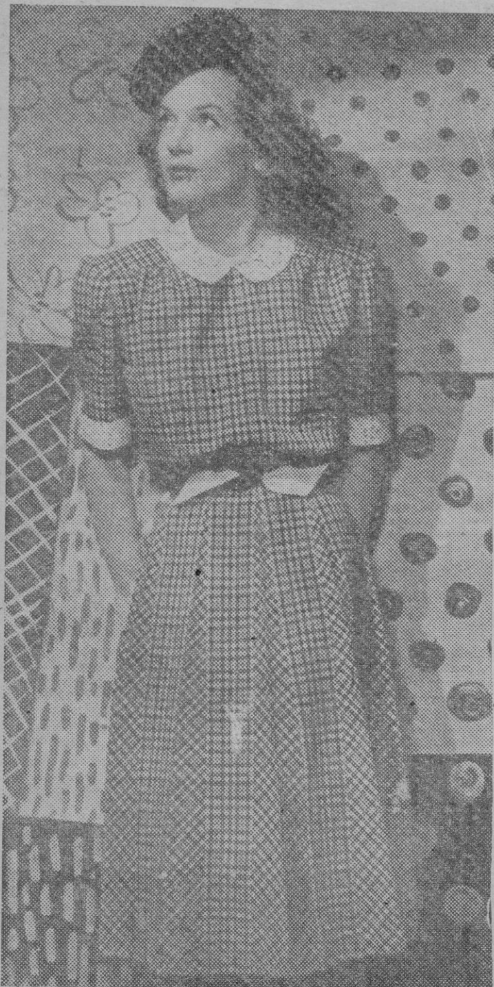
Este bello modelo muestra una feliz combinación cuyo principal encanto reside en la orientación de los cuadros en las distintas piezas que componen el vestido