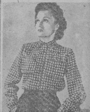
Una linda blusa bordada en lana blanca

ciales de cellovidrio ofreciendo así una economía considerable de espacio.