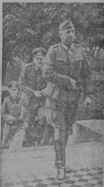
En la foto vemos al mariscal von Manstein en el momento de entrar en el cuartel general alemán al norte de Bjalgorod.