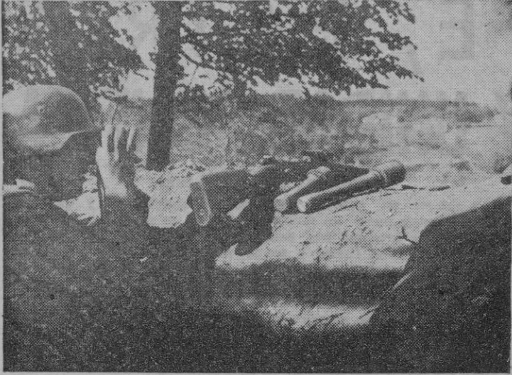
Observador del Ejército alemán en las líneas avanzadas de una posición del frente del Este, vigilando los movimientos del enemigo