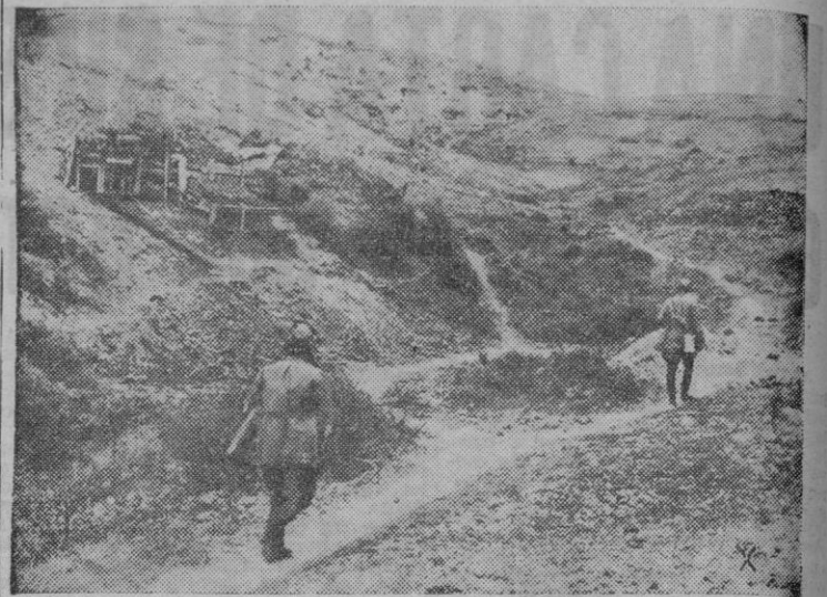
He aquí el aspecto de un sector del Kuban lleno de fortines que constituyen la vivienda de los combatientes alemanes

Miles de productores de minas e industrias pesadas y del campo escucharon atentamente las palabras del Caudillo que abarcaron todos los temas importantes para nuestro Estado, política, economía, industria y trabajo.—Cifra.