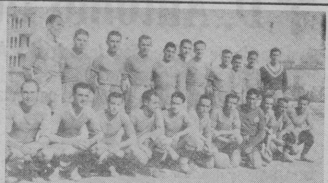
Los equipos representativos de las bases navales de Sóller y de Palma que anteayer libraron un interesantísimo encuentro en el Campo de Buenos Aires

El campo de Buenos Aires será, sin duda alguna, teatro de una de las más interesantes exhibiciones futbolísticas, la ciencia de Campanal, uno de los mejores delanteros centros de categoría internacional, Mateo, excelente medio, también internacional y que tanto se ha distinguido en los últimos partidos que ha celebrado España, ayudados de un conjunto acoplado y de gran rendimiento. Tanto el Constancia como el Mallorca, tendrán que sacar a relucir todo cuanto son y pueden, para dar a la afición mallorquina dos buenas tardes de fútbol.