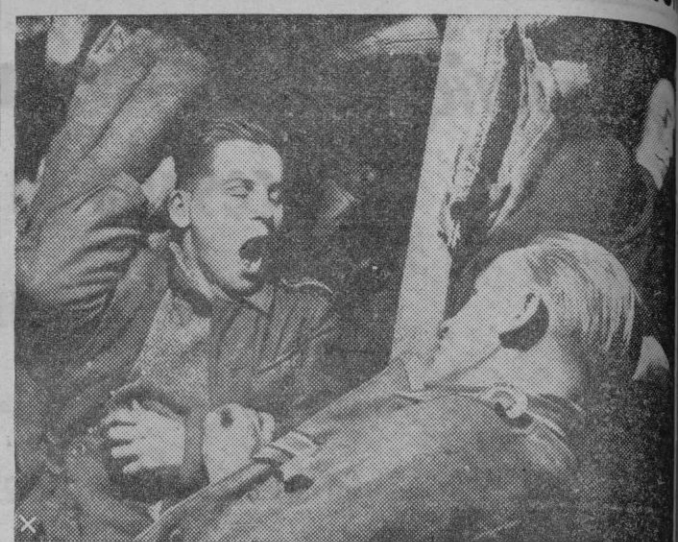
El Jefe de una sección alemana despierta a uno de los enlatados para que le acompañe en la ronda nocturna alrededor de la posición.