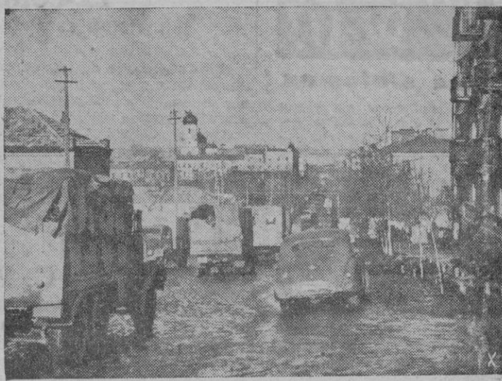
Columnas alemanas de aprovisionamiento se dirigen constantemente a los puntos de partida señalados para el gran ataque de primavera, atravesando pueblos rusos todavía bajo el efecto de las fangosas consecuencias del deshielo tardío