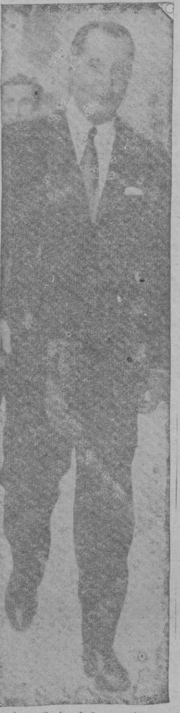
venido». Se ha dado cumplimiento a su orden y se ha dado un paso gigantesco en el acercamiento del pueblo español y de su Falange. Su voz está junto a nosotros, su acento nos guía negando donos todo posible olvido, ya no

cuando se discuta este período de la política española en que mis camaradas y yo hemos inter-