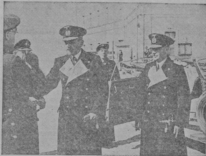
El almirante alemán Carls en viaje de inspección de los puertos ocupados en el litoral francés

"Las grandes potencias han de contar con dos brazos: EJERCITO y DIPLOMACIA"