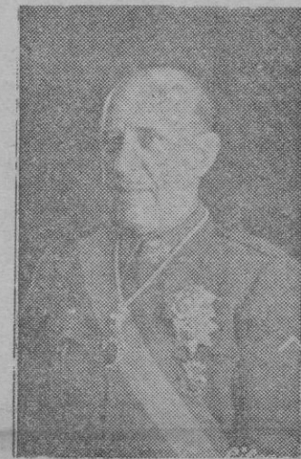
Las grandes naciones, para merecer este nombre han tenido que contar siempre con un poderoso Ejército y con una diplomacia experta.