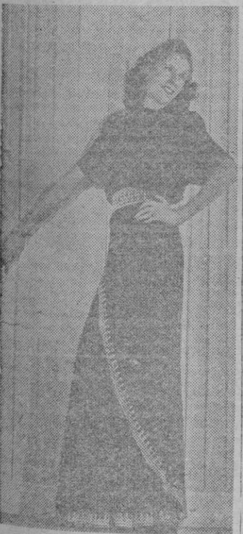
Este gracioso traje de noche presenta un bello adorno, consistente en un galón que, rodeando la cintura, descendiendo inclinado para terminar bordeando la falda.