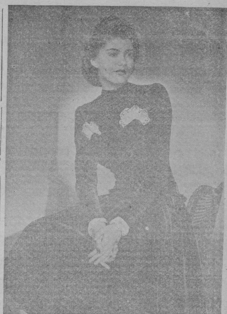
Un bello modelo para fiesta en terciopelo azul pastel con encajes blancos