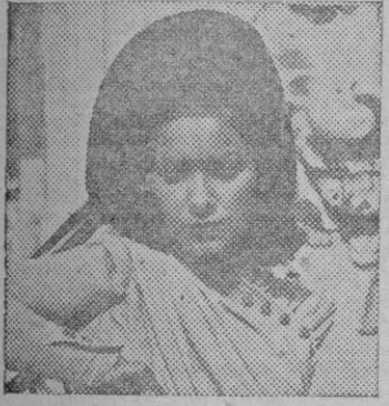
Sombrero de fieltro azul, con el ala lateralmente levantada, dejando la frente descubierta.

Que sonrían a pesar de todo... Y Viena es precisamente de esas ciudades que respetan la tradición de la sonrisa.