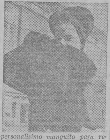
personalísimo manguito para renacer a la vida de la moda juvenil.

No sabemos si esto es tan sólo una innovación o si es un último y desesperado intento del viejo y