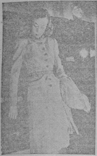
Traje chaqueta abotonado hasta el cuello y ceñido por un estrecho cinturón de cuero grabado. Se completa con un abrigo suelto del mismo tejido.