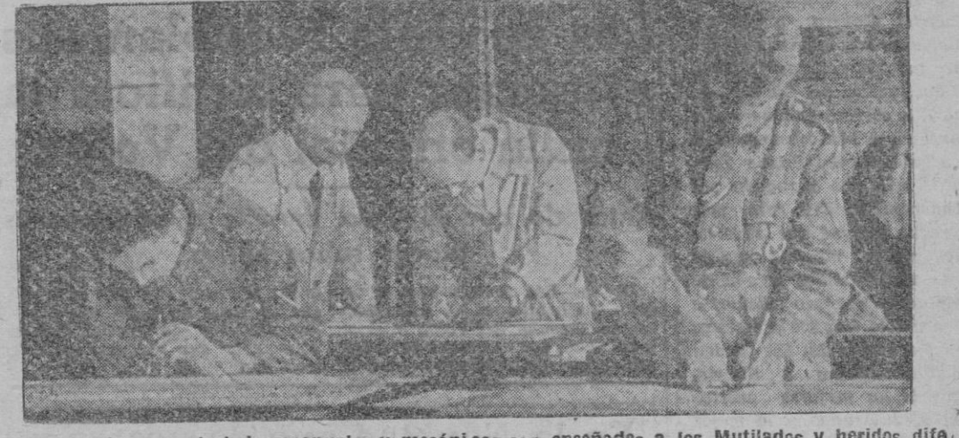
En las escuelas para trabajos manuales y mecánicos son enseñados a los Mutilados y heridos diferentes profesiones y oficios