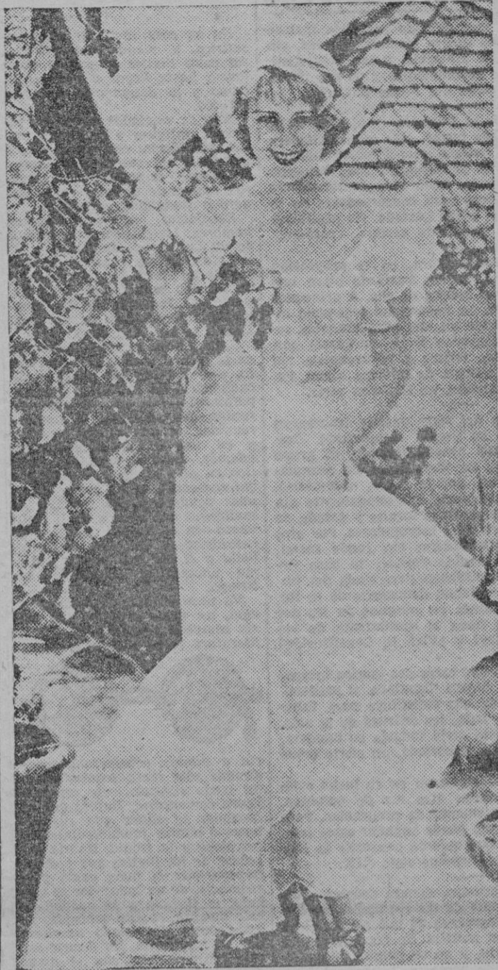
Joan Blondel, una de las artistas que en el transcurso de veinte años ascendió al estrellato, fué famosa y desapareció por completo

Unas veces para mejorar y otras para ofrecernos decepciones y fracasos, los tiempos cambian indudablemente. Y baste para demostrarlo anotar unos cuantos ejemplos en los que se ve perfectamente cómo las más agudas alternativas varían los rumbos de distintas vidas.