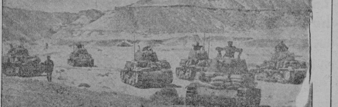
Tanques italianos pertenecientes a las heroicas y bravas columnas blindadas del Eje en Libia, se preparan para contener a las unidades de Montgomery, mientras el grueso puede tomar, intacto, sus posiciones a retaguardia