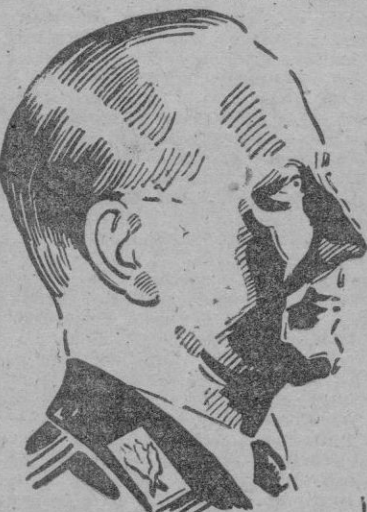
pluma de los periodistas de la Nueva Europa.

es tan grande la responsabilidad que recae sobre ellos. Sobre nosotros. Ahora bien; nosotros, en los países totalitarios, hemos sido liberados de la mentira y la hipocresía y hemos conquistado las cimas de la clara verdad. El periodista europeo, de la nueva Europa se entiende, ha escapado de las garras del capitalismo democrático, y es libre para servir a la verdad de su Patria y de su pueblo. La dependencia puramente económica que con respecto al capital — que por otra parte se ha sometido al servicio del Estado — no deformará ya nunca más la