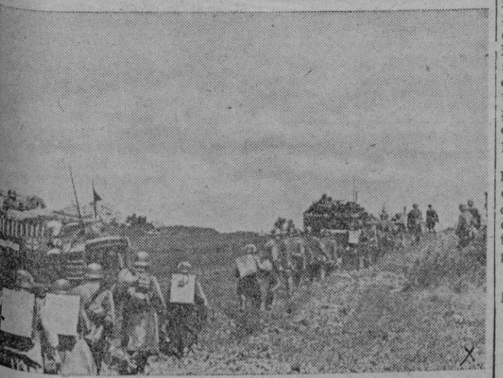
Infantería y tanques alemanes marchan campo atravesado por tierras caucásicas hacia nuevas posiciones.

Fue tal la insistencia de los culpables en buscar el billete que había de resultar forzosamente premiado con el premio mayor, que despertó la alarma en la Policía. De las investigaciones hasta ahora practicadas, se desprende que los niños encargados de cantar los números en el sorteo preparaban de antemano la bola que debía resultar premiada con el premio mayor. En otros sorteos anteriores había ocurrido lo mismo. A consecuencia del hecho que ha producido enorme revuelo ha presentado la dimisión el director de Loterías y el Gobierno ha dispuesto graves sanciones.—Efe.