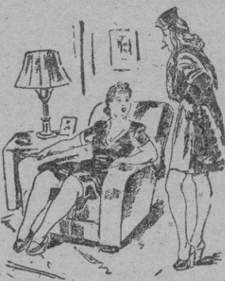
cen ir las novelas que comentamos. Y no hay que olvidar, que bajo una barba de dos días o un aspecto desaliñado, puede ocultarse un corazón ardiente y enamorado.

Por que todos la amaban sin saber quién era. Y había en ellos una constante de trenzas rubias y ojos azules. Y aun algunos forgaron dotaria de facciones y palabras queridas. Habían pasado por las ciudades alemanas, entre sonrisas y vitores. Conociendo la camaradería de los primeros soldados del mundo compartiendo las ilusiones — españolas por ecuménicas — de la gran Alemania. Sabían a lo que habían ido y por qué luchaban en Rusia. Sólo ignoraban el misterio poético que les alumbraba los entresijos del corazón. Lily Marlén, en tanto, buscaba con los ojos azules sobre el recuerdo de calle que le ofrecía un arco, las huellas de los héroes. Acaso llegó hasta ella el eco de la canción, cantada ya en todos los idiomas que en el Este combatían. Acaso no supo nunca que había sido la musa de los héroes rixivos.