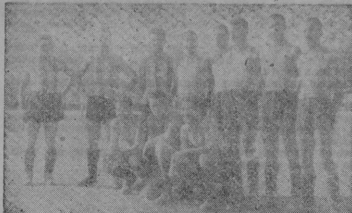
Y este es el equipo que nos enviaron de Manacor sin grandes presunciones de que creyéramos era el primer once