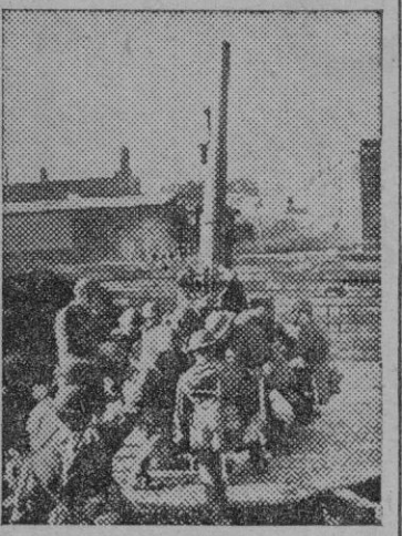
Un cañón antiaéreo, emplazado en uno de los barrios de Nueva York, en previsión de posibles ataques aéreos.