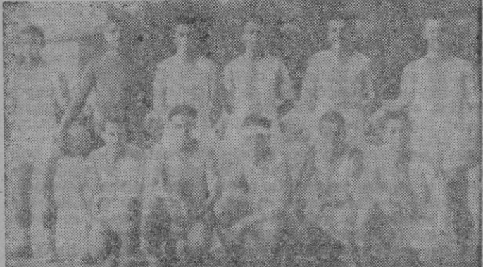
Ahí está el famoso Atlético Baleares, el equipo que tras conjuntarse está llamado a dar muchos sustos