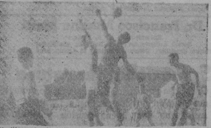
Que diferencia de balles! He ahí al meta del Manacor interpretando un compás de aquella música tan bonita de la «Alegre Divorcada», cuya letra es «Yo se lo ruego...» Y al interior Macías haciendo alarde de conocer a la perfección nuestros «boleros»