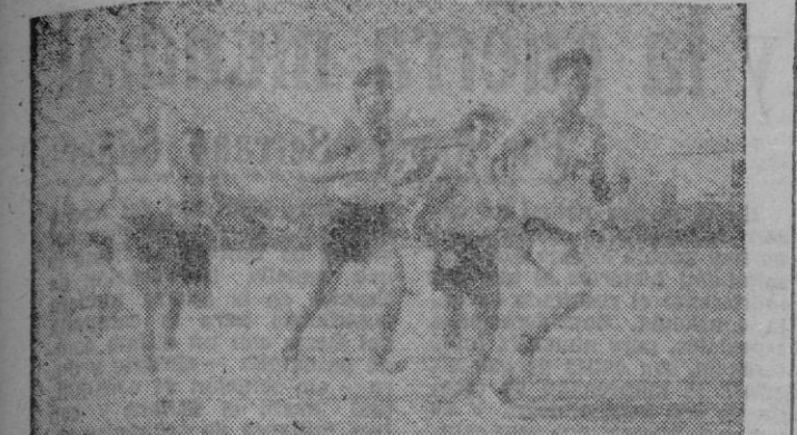
Bosch en un cuarto lugar parece el hombre invisible, y decimos invisible porque por mucho que ustedes se esfuerzen no van a poder verlo. Pasará al primer lugar, pero aún así dudamos que puedan verle... tardará un rato

Formaba parte del programa de festejos populares organizados en la barriada de los Hostaletes una gran prueba atlética consistente en una carrera a pie sobre la distancia de 16 vueltas al campo del Atlético Baleares (Son Canals).