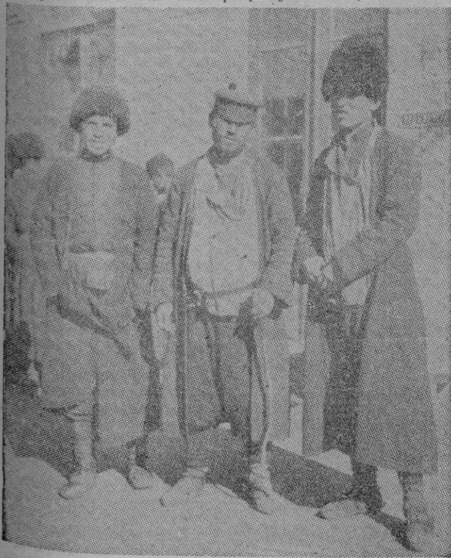
Algunos tipos caucasicos

tos de Bakú en la Transcaucasia (que significa más allá del Cáucaso). Esta ciudad situada en la península de Apseron en el Mar Caspio, se presenta como algo interesante. La antigua ciudad forma como un mundo de santidad flanqueado por casas de madera y barro, con restos, aquí y allá de arquitectura bizantina y persa árabe. En la ciudadela resulta llamativo el palacio del antiguo «Khan» adornado de bellas decoraciones orientales, con dos mezquitas y la gran torre de «Kiolaké» (de los jóvenes) que ha dado lugar a una leyenda romántica. La ciudad moderna que se extiende al pie de la antigua y